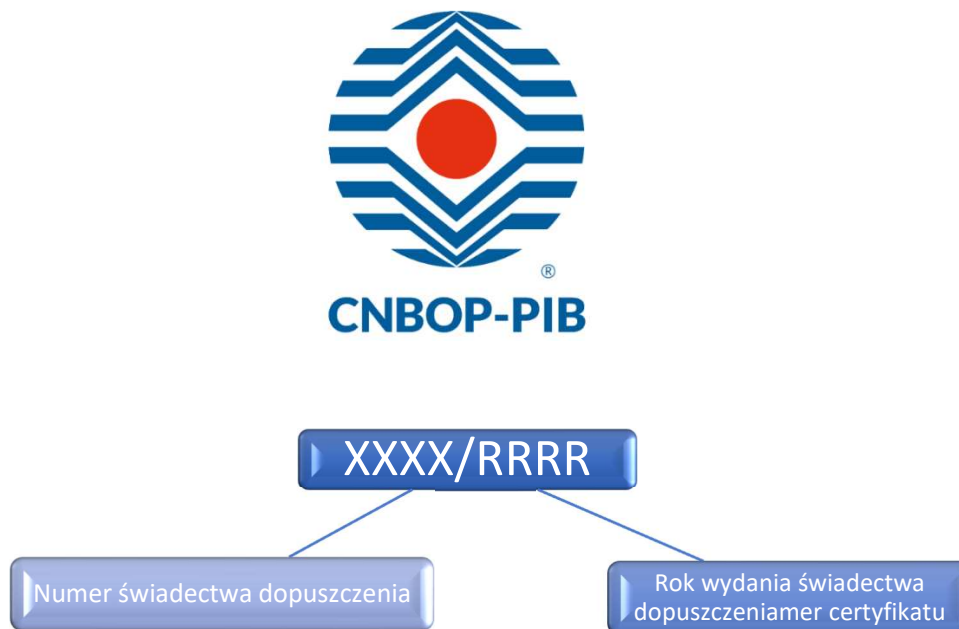
Ryc. 2. Znakowanie wyrobu znakiem jednostki dopuszczającej oraz numerem świadectwa dopuszczenia

Zasady stosowania znaku jednostki dopuszczającej reguluje przepis [5] oraz dokument „Zasady posługiwania się znakiem jednostki dopuszczającej CNBOP-PIB”. Znak jednostki dopuszczającej przedstawiono poniżej.